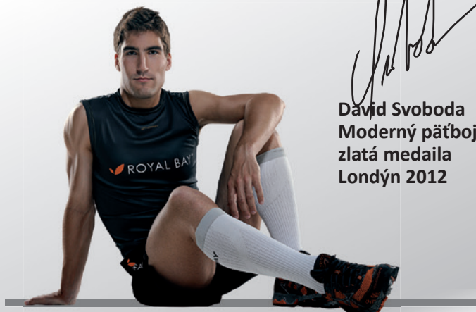
David Svoboda David Svoboda Moderný päťboj zlatá medaila Londýn 2012

Na krátke, ale hlavne na dlhé zaoceánske lety /6 hod. a viac/ - kompresívne produkty zabraňujú opuchaniu nôh a oddávajú pocit únavy a pocit "ťažkých nôh".